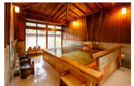
総檜造りの貸切風呂 (小風呂)