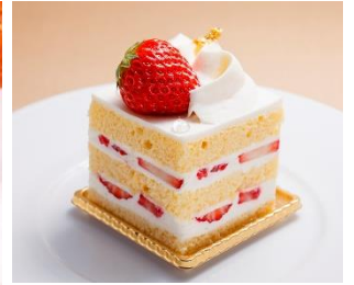
季節のスイーツ イメージ