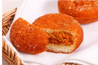
クラシックカレーパン