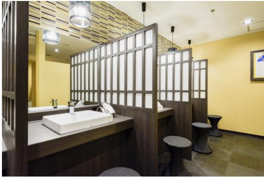
男性洗面カウンター