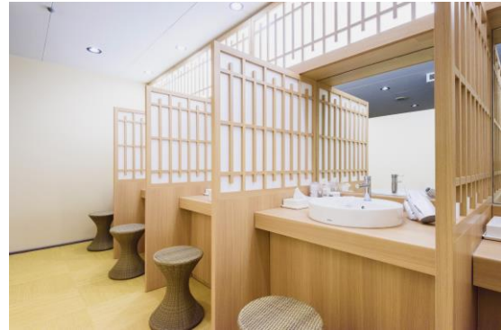
女性洗面カウンター