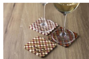
箱根寄木細工オリジナルコースター