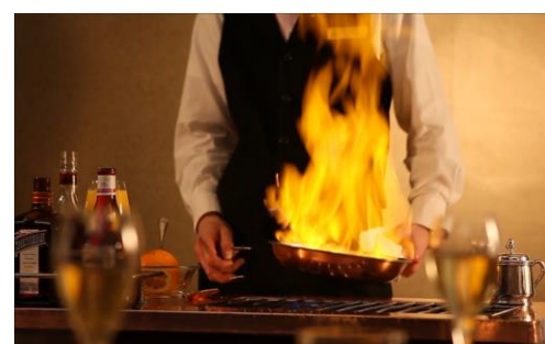
大迫力のフランベサービス