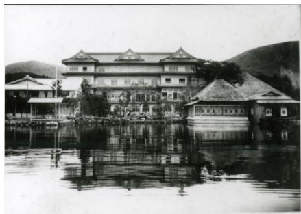
1923年（大正12年）創立時の箱根ホテル