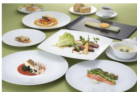
シェフスペシャルコース～Mirage～