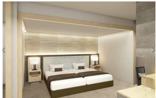
フォレスト・ウイング プレミアスイート イメージ