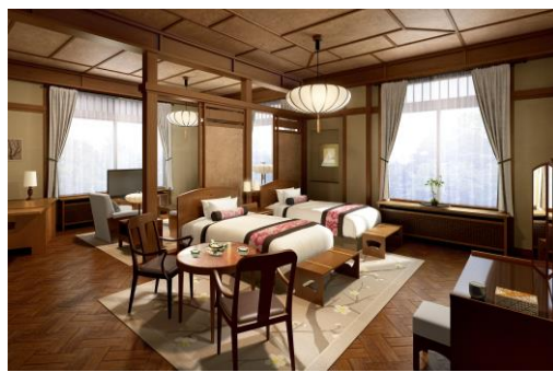
花御殿 ヒストリックジュニアスイート イメージ