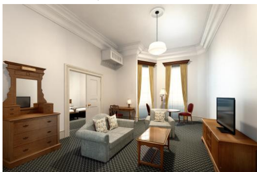
西洋館 ヒストリックスイート イメージ