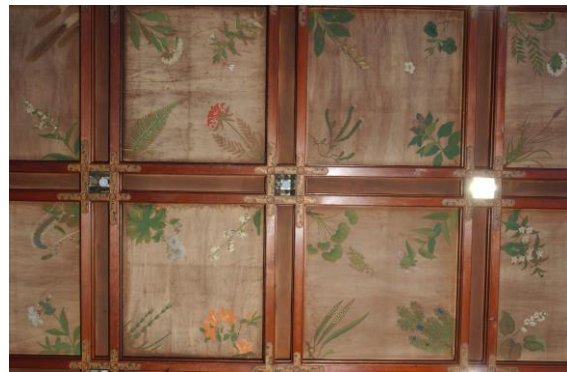
文化財補修の専門家による格天井の復原