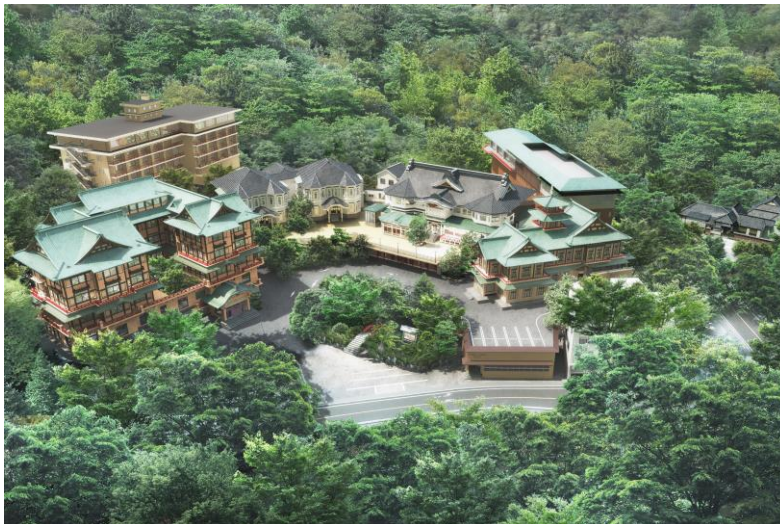
富士屋ホテル 全景 イメージ

グランドオープンに先立ち2020年1月1日(水)10時よりお電話によるご宿泊及びレストラン予約と弊社WEBサイト(URL https://www.fujiyahotel.jp )によるご宿泊予約の受付を開始いたします。