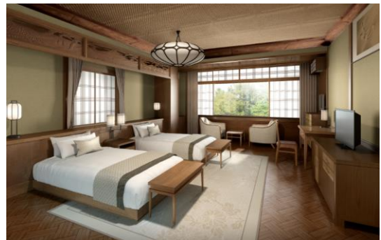
フォレスト・ウイング コーナーツイン イメージ