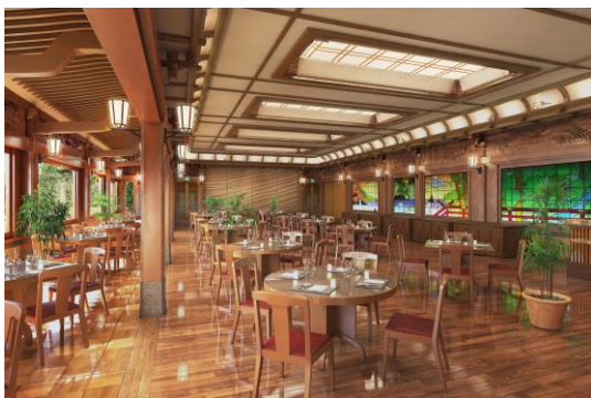
レストラン・カスケード イメージ

大正9年建築の旧宴会場「カスケードルーム」を復原したレストランを最上階に新設、欄間の彫刻、壁面のステンドグラスは補修され再び華やかな時間を演出します。