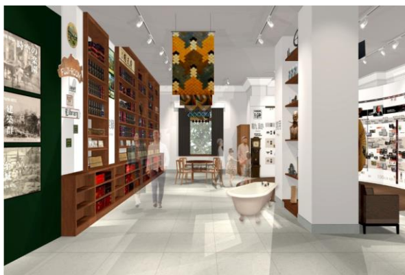
ホテル・ミュージアム イメージ