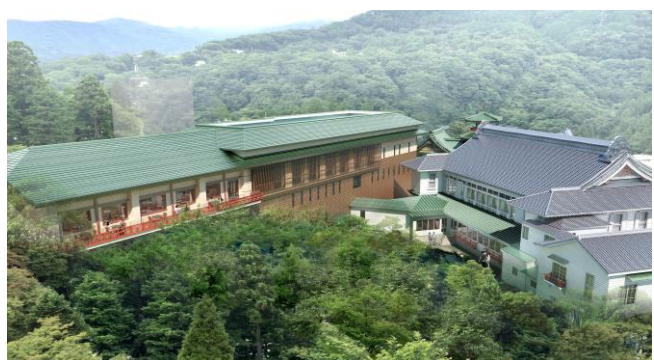
カスケード・ウイング 外観 イメージ