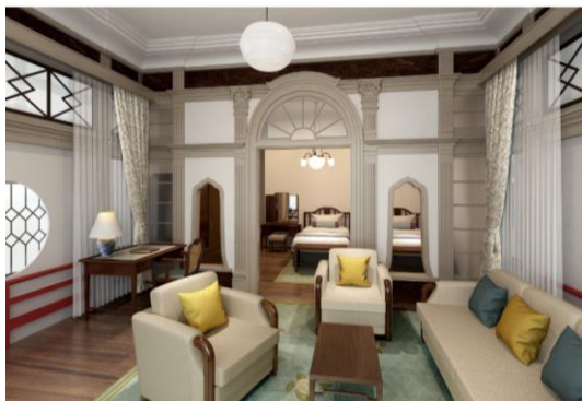
本館 ヒストリックジュニアスイート イメージ