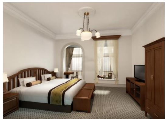
本館 ヒストリックハリウッドツイン イメージ 2