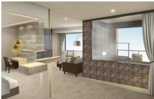
フォレスト・ウイング プレミアスイート イメージ