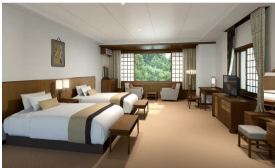
フォレスト・ウイング ツイン フォレストサイド イメージ