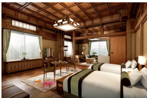
花御殿 ヘリテージルーム菊 イメージ