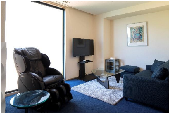
コンフォートルーム