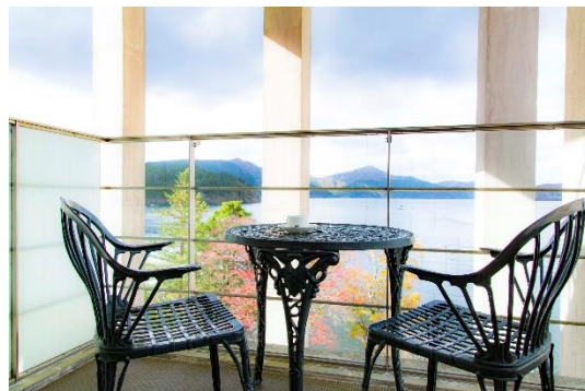
ジュニアスイートルームテラス