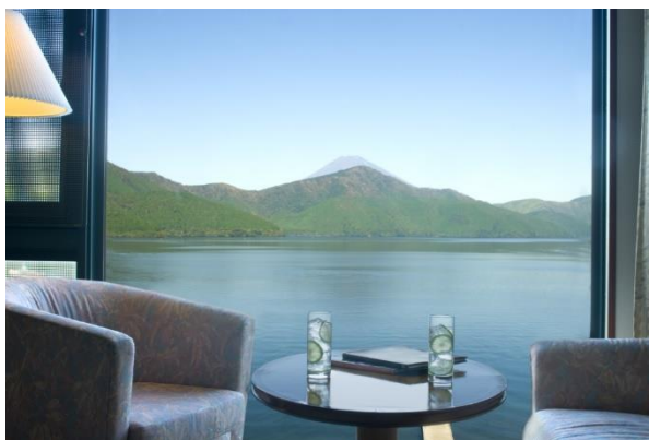
スーペリアツインルームからの眺め