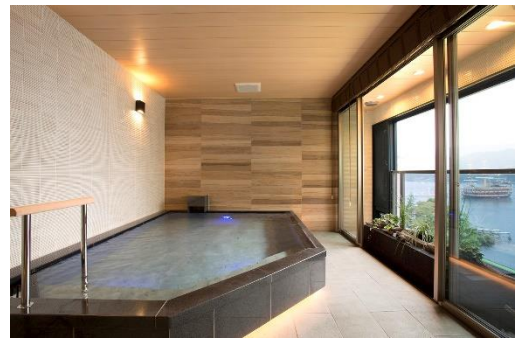
温泉浴場(芦ノ湖の湯)