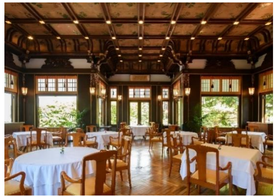
メインダイニングルーム・ザ・フジヤ