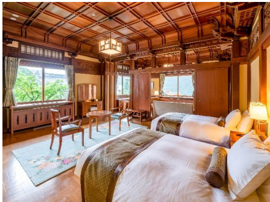
花御殿 ヘリテージルーム菊