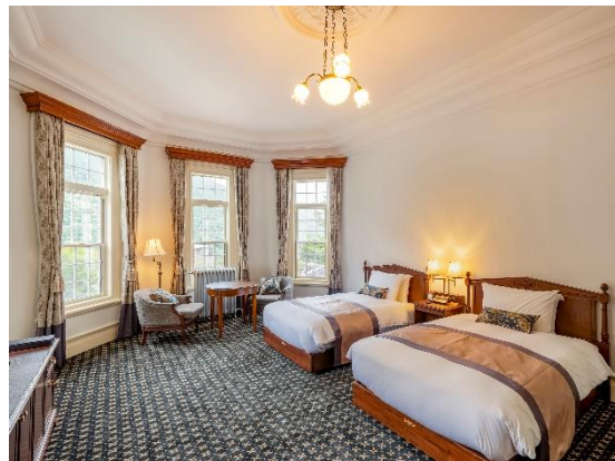
西洋館 ヒストリックデラックスツイン