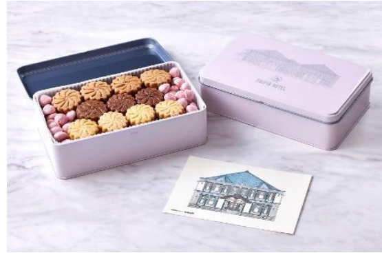
特典「西洋館焼き菓子詰め合わせ」