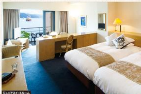
ジュニアスイートルーム