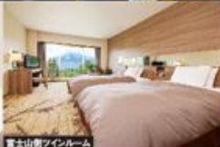
富士山景アインルーム