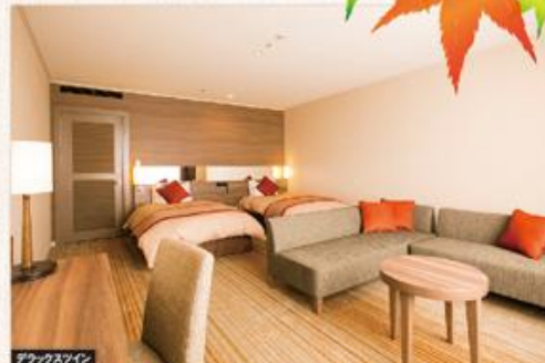
デラックスツイン

開催期間:2018年11月1日(木)～2018年11月23日(金) 富士河口湖紅葉まつり(富士ビューホテルより車で約10分) 紅葉祭り期間中は22:00までの間ライトアップもされ、日中も日没後も紅葉をご覧ください。