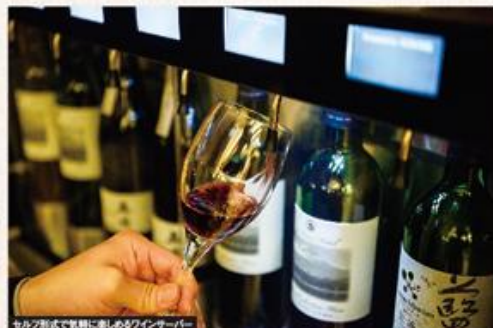
セルフ形式で気軽に楽しめるワインサーバー