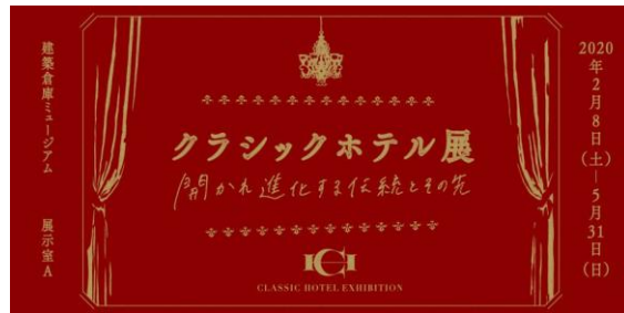
クラシックホテル展 キービジュアル