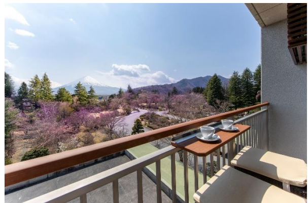
富士山を望むテラス