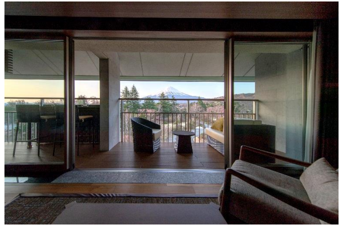
客室から望む富士山